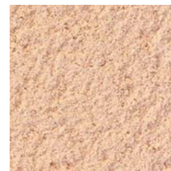
Brut de projection

Effectuer une passe de l'ordre de 8 mm environ, serrer et dresser grossièrement. Après 1 à 6 heures réaliser le grain (7 mm) qui peut être écrasé avec une taloche avant durcissement pour la finition «écrasée» ou laissé «brut de projection»